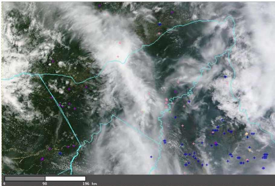
DISTRIBUCIÓN DE FOCOS DE CALOR DEL DEPARTAMENTO CON IMAGEN MODIS DE FECHA 18-OCT-2010

Para hoy 18-OCT-2010 existen 18 focos de calor en el departamento de Pando.